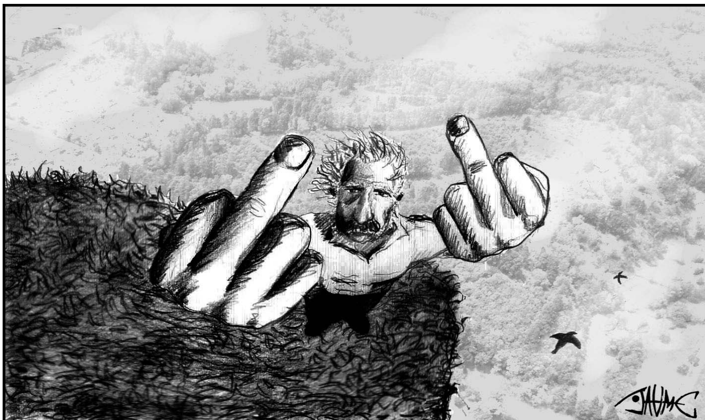
“El borde del precipicio”