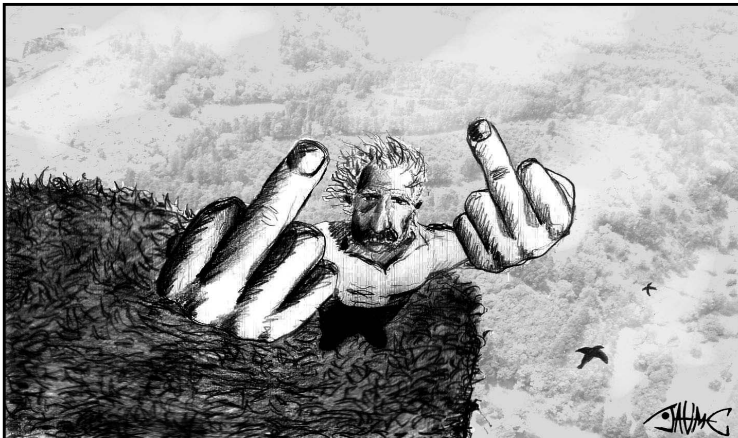
“El borde del precipicio”