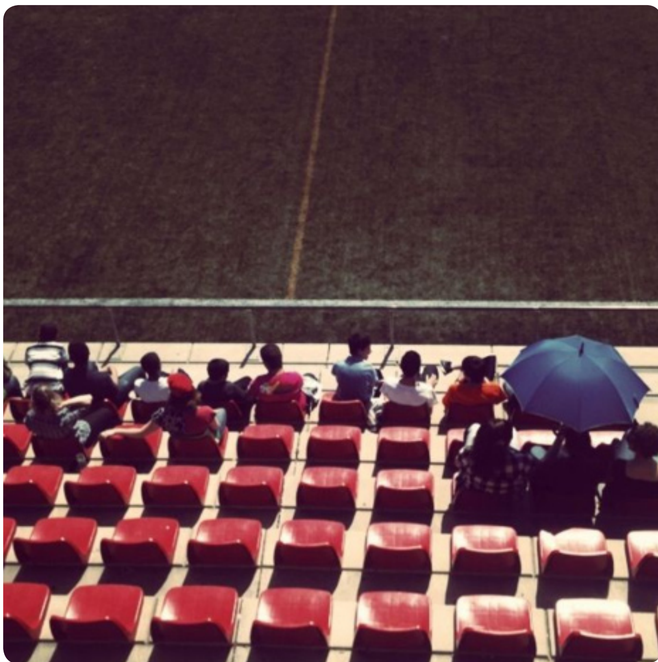
David Lladó / No groc

Ruleta rusa / David Lladó / No groc Random writings / Francesca Viana / Dame fuerte por la derecha DeGéneros / Adolfo Martín / Your picture is still on my wall Rizomas Pictóricos / Pilar Cobo / ¡Porque sí! A solas con el mundo / Albert Pérez / Luces, colores, sombras / Caraduras / Albert Lladó / Antonio López y López Títol esgotat / Jaume Bagés / Història de Catalunya